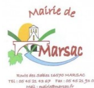
Mairie de Marsac