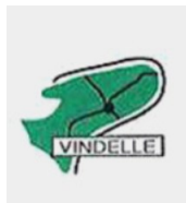
Mairie de Vindelle