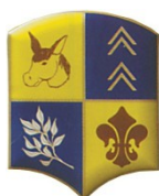
Mairie d'Asnières sur Nouère

3 ans : 2013-2014 / 2014-2015 / 2015-2016